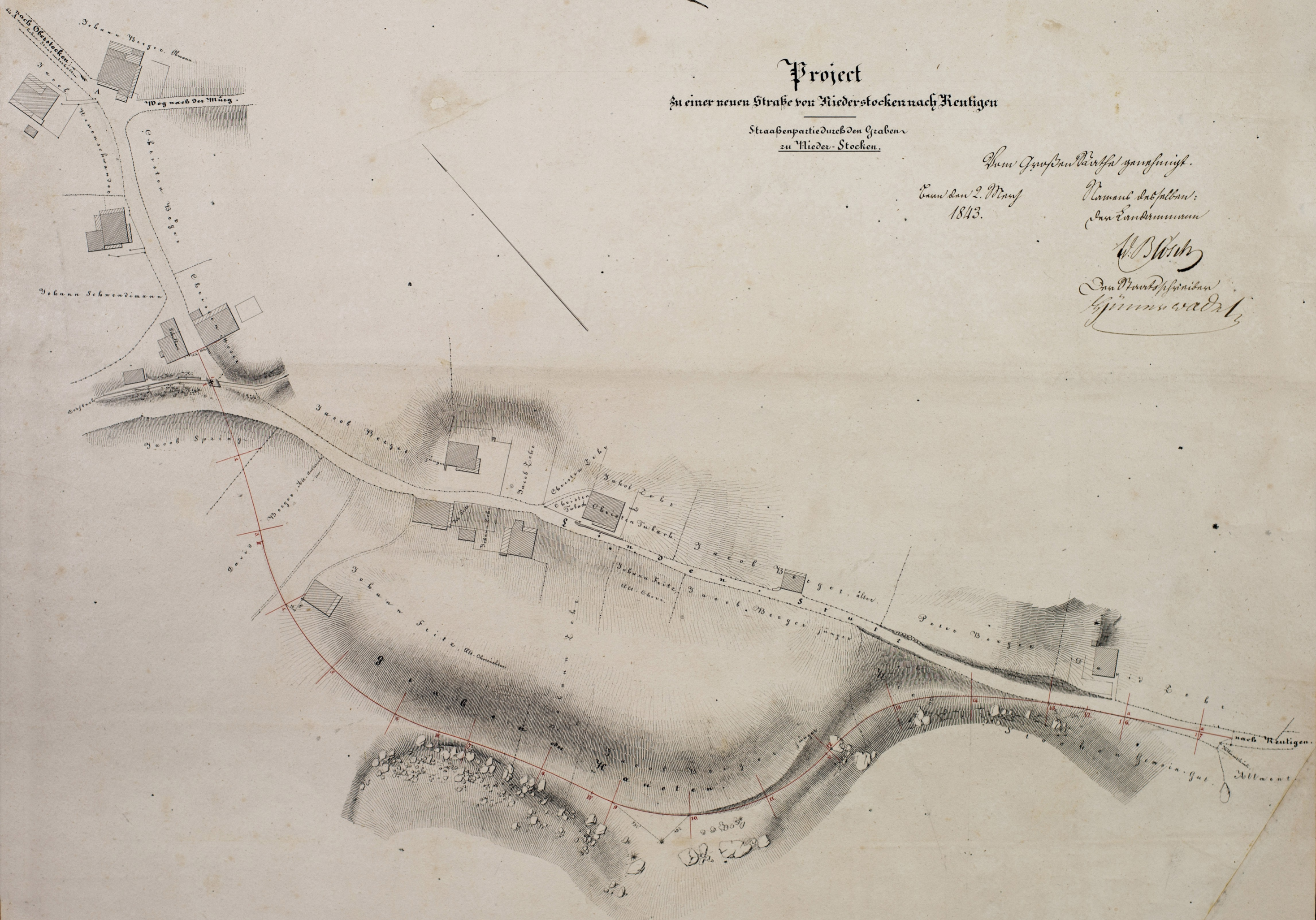
Maastab der natürlichen Größe

Zum Gräben Parthel genehmigt. Erm. am 2. März 1843. Königl. Landbauamt J. B. Blöcher Im Auftrag des Königl. Bauamts H. J. Müller